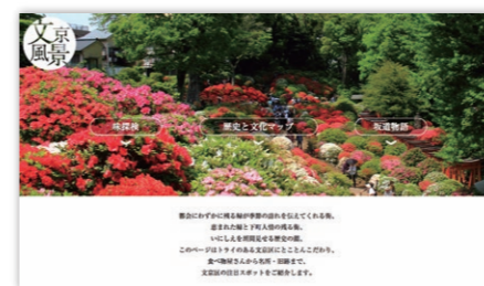
当社HP内のコンテンツ「文京風景」 創業以来38年、文京区で営業しており 地域活性のための情報を発信