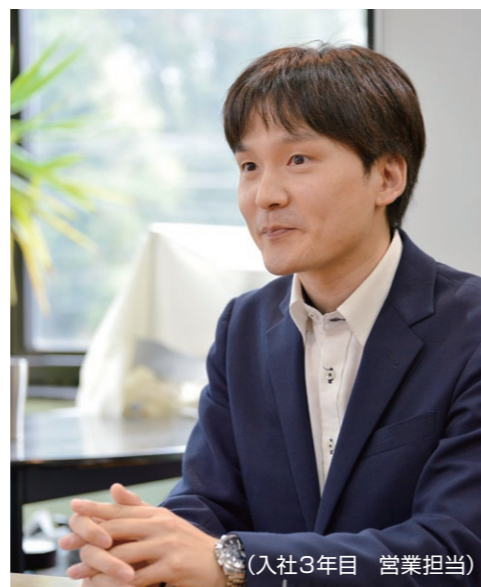
(入社3年目 営業担当)

私たちは、創業38年の実績をもつ総合制作会社です。「トータル&ワンストップ」で、広報誌や会社案内等の印刷物から、ホームページ制作やシステム・アプリ開発、またイベントの企画・運営なども提供しています。