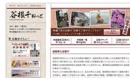
「谷根千ねっと」の維持・運営にも協力